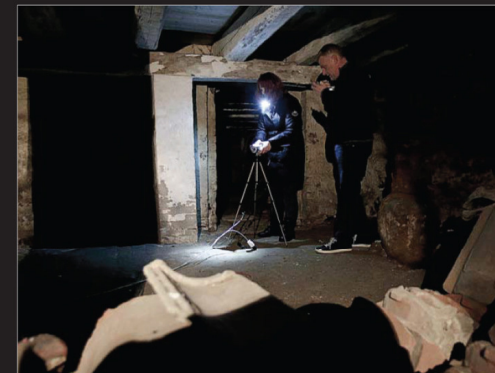
Når de fire jægere pludselig fryser og beder om stilhed, fordi de har hørt noget, er de alene om det. Det virker, som om det kun er for de indviede.