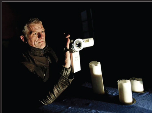
I følge spøgelsesjægerne skal man ikke være bange for spøgelser. De skal bare behandles med respekt. – De tror, at nogle vil gøre sig bemærket, så vi er klar over, at de er her. Andre vil bare have kommunikeret deres sidste besked.