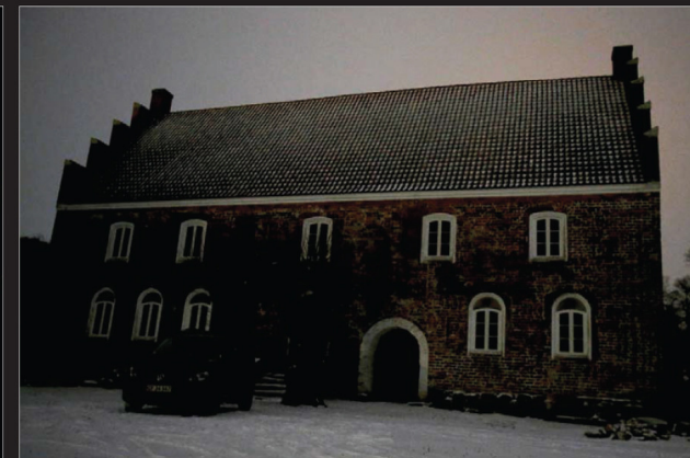
Da jagten er slut for EKSTRAS vedkommende, gøres der status: – Der er ikke sket særlig meget. Måske skyldes det tidspunktet, eller at det er for koldt. Ellers også har det noget med månen at gøre, lyder forklaringen.